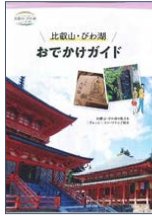
通年パンフレット (A4/8 ページ)