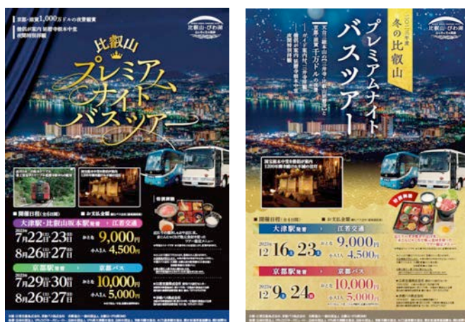
バスツアーチラシ（左：夏、右：冬）